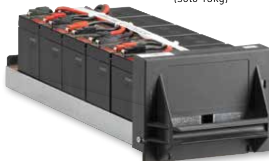
Modulo batterie maneggevole e semplice da installare (solo 13kg)