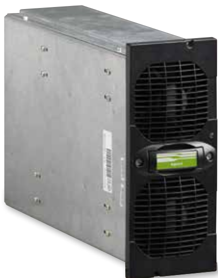
Modulo di potenza monofase compatto e leggero (solo 8,5 kg)