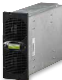
3 108 71