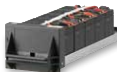
3 108 75