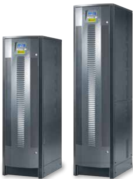
3 109 90